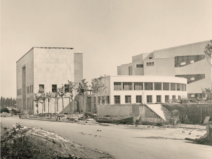
Gio Ponti. Scuola di Matematica (1932-35) alla Città Universitaria di Roma